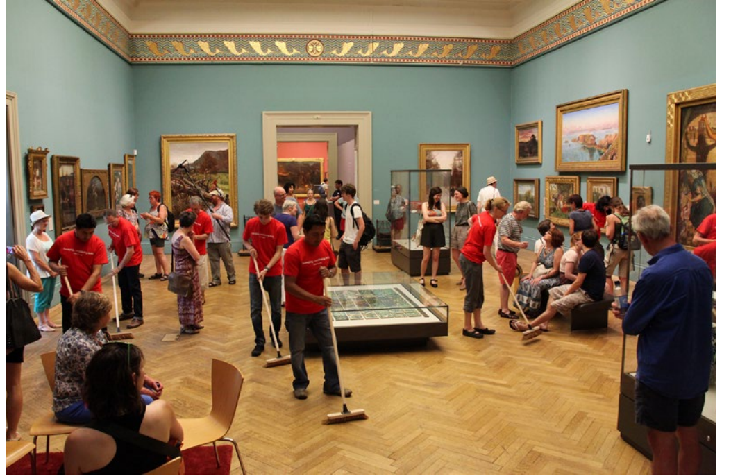
Suzanne Lacy (Meg Parnell ile beraber), Cleaning Conditions: An Homage to Allan Kaprow, Hans Ulrich Obrist küratörlüğünde do it 2013 sergisinden, Manchester Galerisi, İngiltere, 2013.

Çok iyi bir soru. İdamenin uygulandığı ölçek bakımdan farklı. İdame; genellikle kamusal alanda, altyapıyla ilgili projeler kapsamında kullanılıyor. Kimi zaman teknoloji için de kullanıyoruz, örneğin sabit diskimizin idame kapsamında tamirde olduğunu söylüyoruz. İdamenin katı, teknolojiyle bağlantılı bir yanı var; bakım ise, en azından gündelik dilde daha feminize edilmiş bir çağrışıma sahip ve bireyler arasında ilişkiler kapsamında uygulanıyor. Ölçek ve uygulama biçimleriyle ilgili bu tür cinsiyet ayrımlarını fark eden tek kişi ben değilim, ayrıca daha ayrıntılı bir inceleme birtakım istisnalara da işaret edebilir. Buna rağmen bu iki kavramın farklı öznelliklere sahip olduğunu, farklı ölçeklerde uygulandığını söylemek yanlış olmaz.