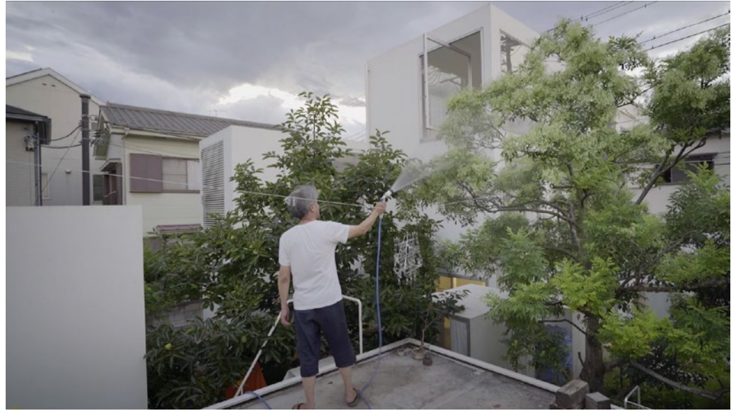
Beka & Lemoine' nin Moriyama-San filminden bir kare (2017).

İdamenin emekle ilgili yanına da değinmek istiyorum. Maison Bordeaux'ya dönersek, evin yardımcısı Acedo'nun evi temizlerken gösterdiği adanmışlıktan, kendi evinden çok orada vakit geçirdiğinden, aslında bir nevi orada yaşadığından bahsediyorsunuz. Yapıları idame ettirenler ve bakım verenler, diğer işçilere kıyasla çalışma sahasıyla farklı bir ilişki kuruyor, bu da ev hayatı ve sömürüyle ilgili bir takım zor soruları ortaya çıkarıyor. Yapıları idame ettiren işçilerin emek koşullarına dair ne söylersiniz?